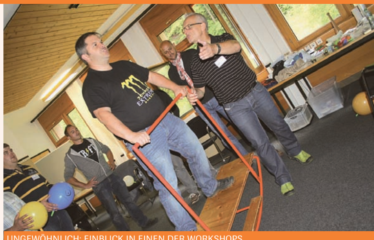
UNGEWÖHNLICH: EINBLICK IN EINEN DER WORKSHOPS.