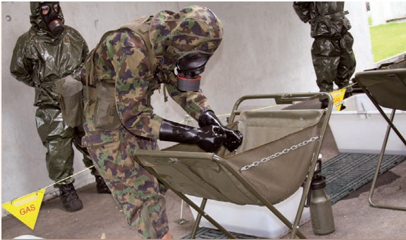
ALLA PORTATA DI TUTTI: BASI DELLA DECONTAMINAZIONE NBC.