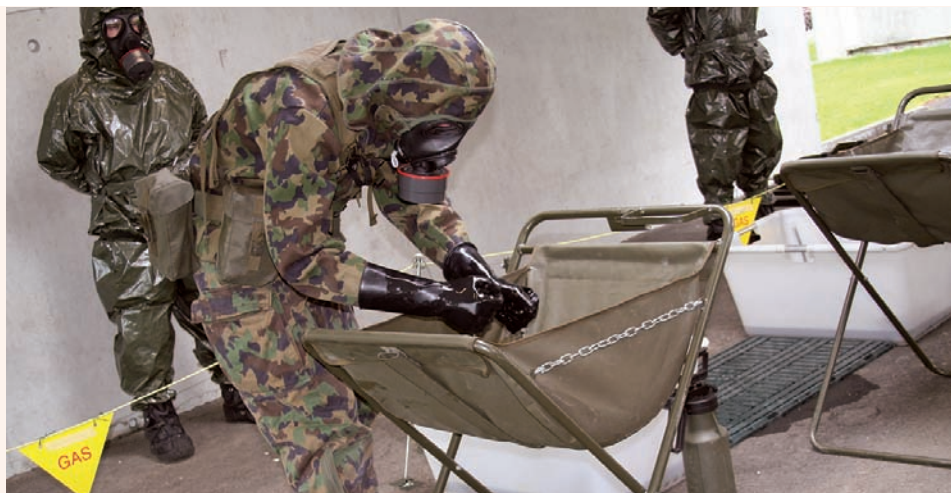
BASES DE LA DÉCONTAMINATION ABC